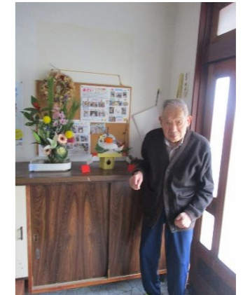
おせちをつめて、お正月飾りをして歳神様をお迎えする準備ができました！